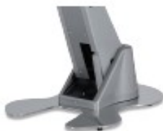
E29 Base standard cromada