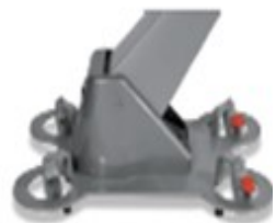
EL07 Base en acero con ruedas