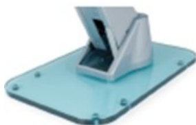
BCR Base cristal transparente espesor 19 mm.