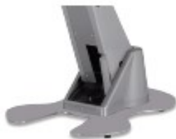
E30 Base standard pintada