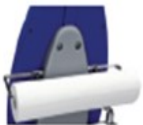
12900017 Portarollos de papel