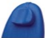
12500007 Reposacabezas ajustable en altura