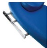
12900023 Barra porta accesorios