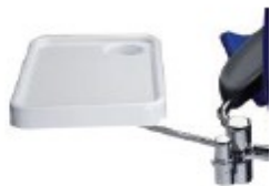
12900018 Bandeja auxiliar retráctil