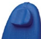
12500007 Reposacabezas ajustable en altura