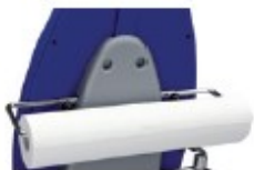
12900017 Portarrollos de papel