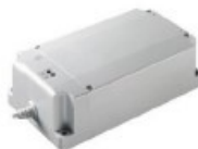
12500009 Batería de emergencia