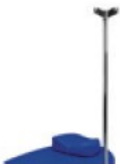
12000012 Portasuero con dos ganchos